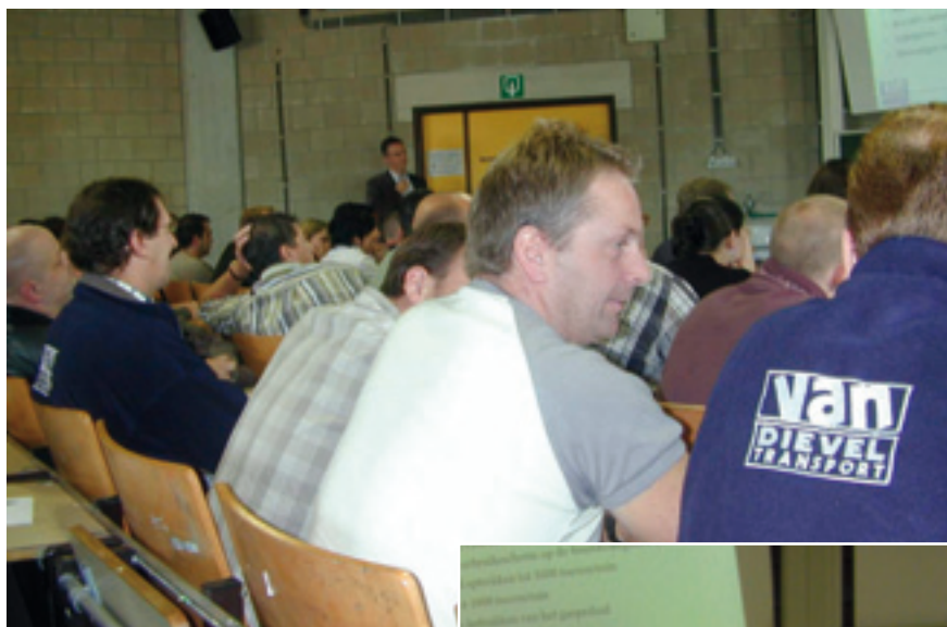
Een auditorium vol VDT-chauffeurs die luisteren naar de stand van zaken over het eco-proactief rijden.

Verantwoordelijke uitgever: Louis De Wael, Kalkoenstraat 40, 2860 Sint-Katelijne-Waver