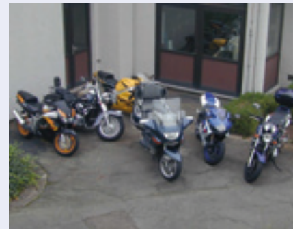
Op deze foto missen wij er wel een paar; de bijscholing verliep immers over twee dagen. De foto werd gemaakt op de eerste bijscholings(zater)dag.

Maar motorrijden op de Belgische wegen is gevaarlijk en wordt met de dag gevaarlijker. Er komen er de jongste jaren steeds meer en het verkeer op onze wegen is overdruk. Het aantal omgekomen motorrijders steeg daardoor met 39% tussen 2000 en 2003. Als je dan beseft dat tussen 2001 en 2005 het aantal verkeersdoden over het algemeen zakte... !