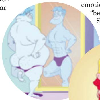
Een nieuwkomer ziet zichzelf door (de spiegel van) de collega's.

Overigens blijkt het dat emoties elkaar "besmetten" (dixit Sylvie Van Belle).